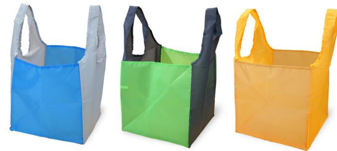
図. オリジナルエコバッグの開発・販売によるレジ袋削減（食料品スーパー）