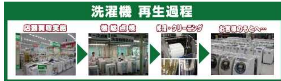
リユース生産フロー