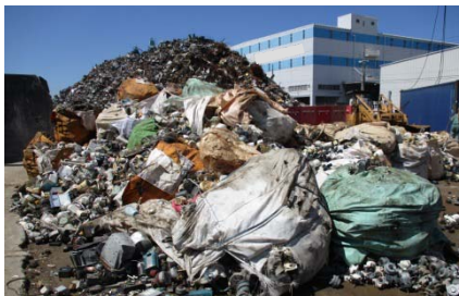
廃電子基板等の 電子部品スクラップ