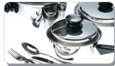
ステンレス製品など