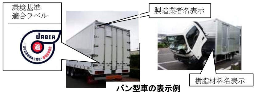
バン型車の表示例