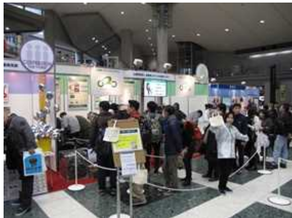
< 東京モーターサイクルショー >