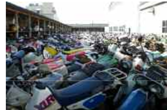
買取車両の屋外保管