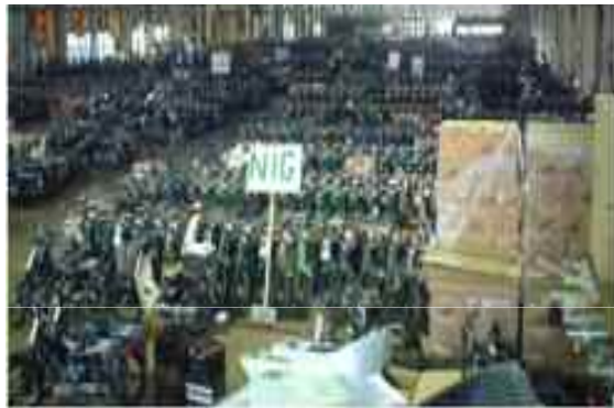
大手輸出会社の倉庫内(約7000坪におよそ2万台の在庫を有している)

ヒアリングにおいて、輸出事業者が入手できる中古車が減少しているとのコメントが多かった。国内での中古車需要が高まり、中古車両そのものの台数減少と中古車の価格が高止まりであるため、輸出向け中古二輪車を入手しにくくなっている。また、廃棄同然の車両であっても部品取用に使うので、引取るとのことであった。(部品のみを輸出することが目的ではないが、完成車両を輸出する際、その付加価値を高めるために、交換用に部品を同梱して輸出する。)