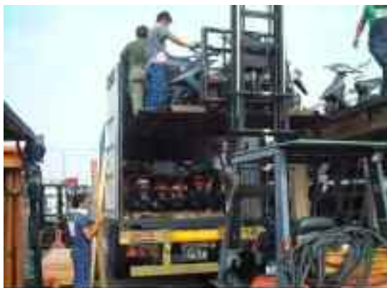
輸出用コンテナへの詰め込み作業