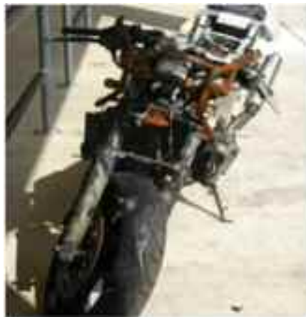
前部が燃えたバイク(オークションに出品される)

オークションへの出品台数の変化をみると、1991年を100とした場合、2005年に211.9%と15年で2倍強の扱いとなる一方、成約台数は2000年に既に1991年の2倍に達し、2005年には1991年の2.5倍と、出品台数増加速度を上回る速さで成約台数が増えている(右グラフ)。この背景には高額車両から廉価車両まで幅広い車種において旺盛な輸出需要がある。中古二輪車の相場が高くなり、廃棄に相当する二輪車であっても出品され、取扱台数が増えていった。