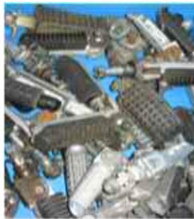
ペダルの入った箱(部品だけを集めてオークションに出品される)