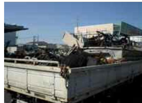
平ボディトラックに積み込まれ金属商に売却される有価物(月1回程度)