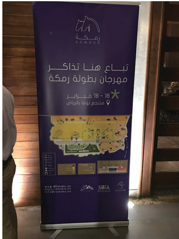
ラマカの広告（2017年2月，リヤドのレストランにて）

など、馬好きのためのイベント「ラマカ」が開催された。一般人が空き時間と自家用車を使って他人を運ぶ自動車配車サービスを展開する会社「カリーム」は、ラマカを訪れる際に同社のサービスを利用すれば料金が半額になると、ラマカのインスタグラム・サイトに広告を掲載した。ウーバーやカリームの利用は若いサウジ人女性の間で急増しており、交通手段のない女性にも来場の機会を提供しようとしていることがわかる。