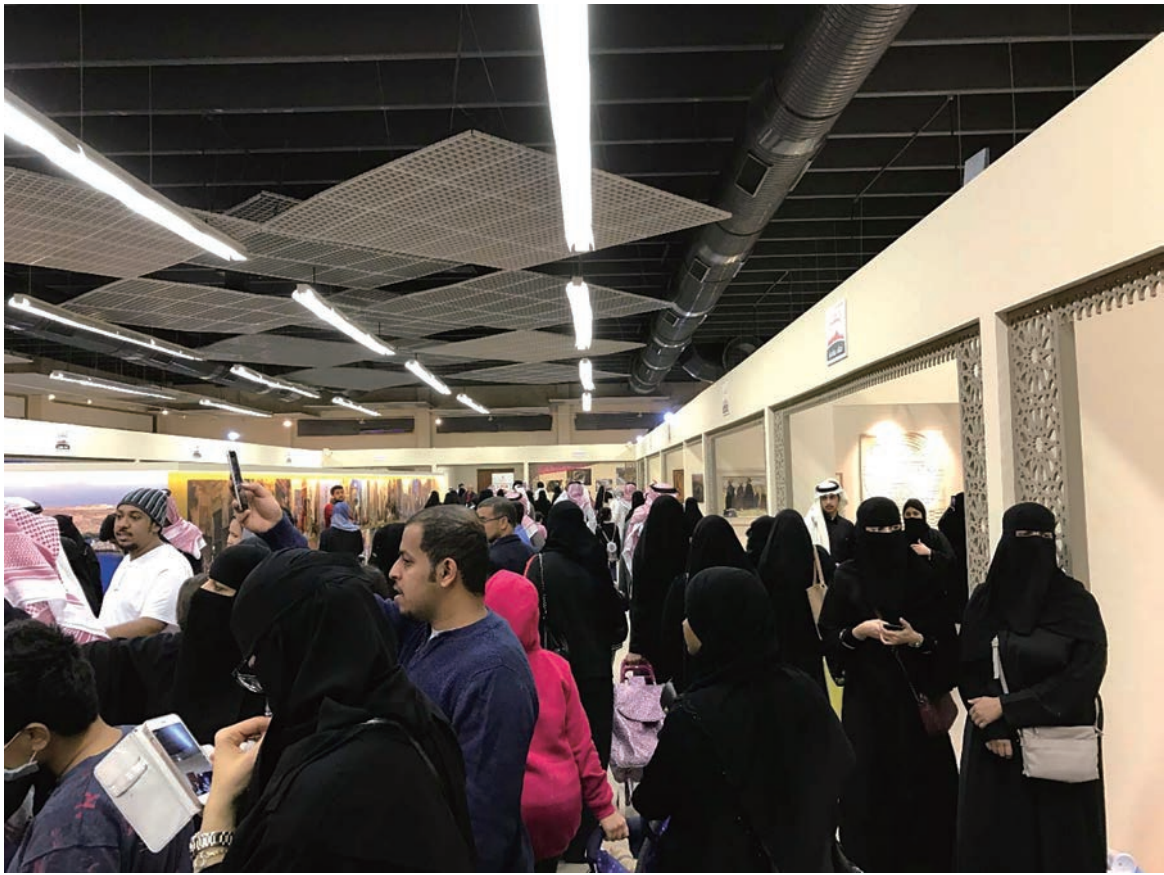
ジャナドリーヤは大勢の男女の客で賑わった (2017年2月, ジャナドリーヤにて筆者撮影)

の入場料は150リヤル, ラマカの入場料は90リヤルだった。これらのイベントでは, ブースの出展者からも出展料を徴収していると考えられるため, イベント収入は少なくとも二方向から得ることができる。