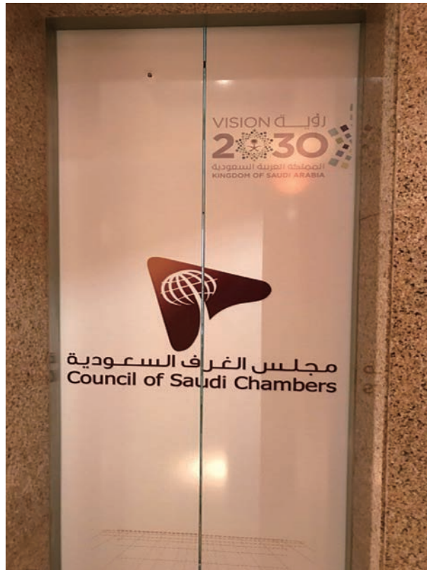
各地に掲げられる「ビジョン2030」のロゴ (2017年3月, リヤドにて筆者撮影)