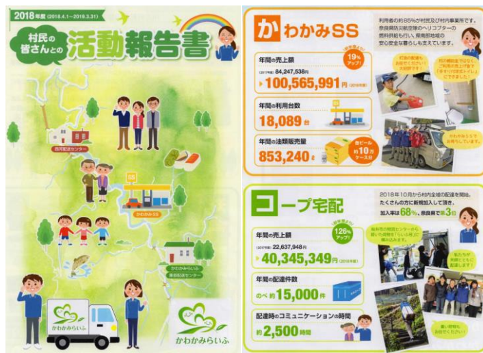
図2 一般社団法人かわかみらいふの活動報告書（2018年度）