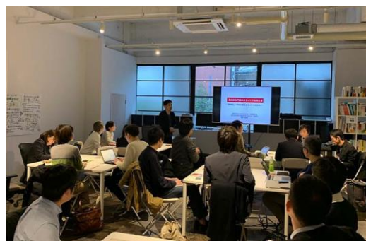
図4 拠点を活用したワークショップ (長野県長野市)